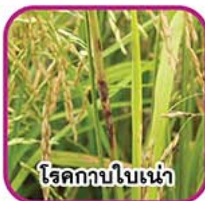
โรคนิวจุดสีน้ำตาล