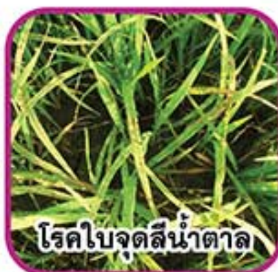
โรคนิวจุดสีน้ำตาล