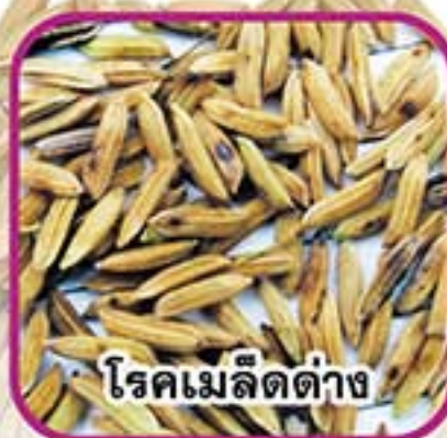
โรคนิวจุดสีน้ำตาล