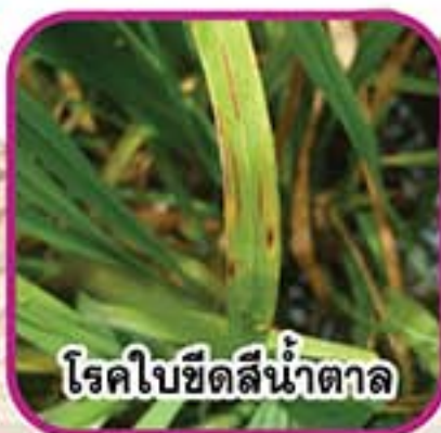
โรคนิวจุดสีน้ำตาล